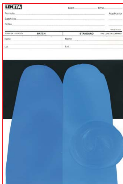
Рис. 2. Проверка совместимости колеровочной пасты с базовой краской с помощью «rub-out»-теста.