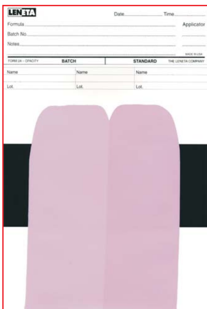
Рис. 1. Влияние совместимости колеровочной пасты с базовой краской на интенсивность цвета.

Важнейшие технические свойства колеровочных паст можно разбить на следующие 5 разделов: